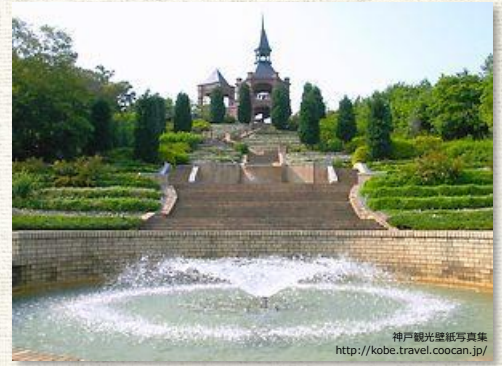
神戸観光協会の写真集 http://kobe.travel.coocan.jp/

北播支部には、癒しのスポットが数えきれないほどあります。その中で、今回わたしたちが特にお勧めしたいのは播磨中央公園です。赤ちゃんからシニアの方に至るまで楽しめる公園です。隅々まで手入れが行き届き、それはそれは気持ちの良いところです。