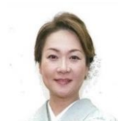
参議院議員 たかがい恵美子