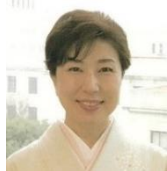
衆議院議員 木村やよい