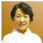
衆議院議員 あべ俊子