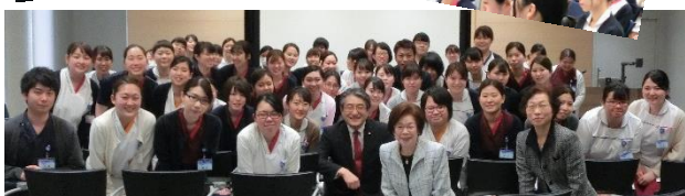
新入職員と一緒に