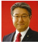
参議院議員 石田まさひろ