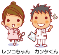
レンコちゃん カンタクん

看護協会の掲げる理念と使命を実現するために政治活動を行う組織です。看護職が抱える様々な問題の中には、政治的手段によってしか解決できない問題があります。そのためには、看護職の代表を国政に送り、看護協会の目指す政策や意見を反映させ、解決していかなければなりません。組織代表を国政に送り、法律の制定や改正・労働条件・看護教育の改善などに大きく貢献しています。