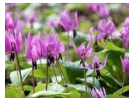
丹波市の花：かたくり