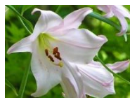
篠山市の花：ささゆり

摂丹支部は、三田市・篠山市・丹波市の3市からなり、平成29年度からは阪神北地区の支部として活動しています。これまでに一人以上の入会が一度でもあった施設は、公的機関：7、民間病院等：7、福祉施設等：7、看護学校：2、訪問看護ステーション：11の計40施設でした。しかし、現時点での加入施設は、8施設のみです。加入施設増につながっての会員増に向けていくことを目標に、支部3役とオブザーバーそしてOBからの役員6人で、経験と感性の知恵を出し合っています。なかなか名案はありませんが、「他・他支部が出来ていることは私達にも出来るはず！！」を合言葉に、コツコツ・こつこつの活動です。