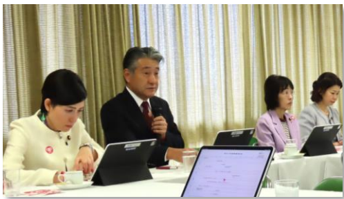
女性局長代理を務めています

昨年、日本看護連盟通常総会において、次期参議院議員選挙の組織内候補予定者としてご承認をいただきました。初当選以降、組織代表の看護職議員として、看護協会が提言する看護政策実現のため力を尽くして参りました。本年も引き続き、現場の声をしっかりと受け止め、看護連盟・看護協会と連携しながら活動して参ります。