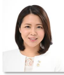
参議院議員 友納 りお

謹んで新年のご挨拶を申し上げますとともに、この度の地震により被災された皆さまに心よりお見舞い申し上げます。