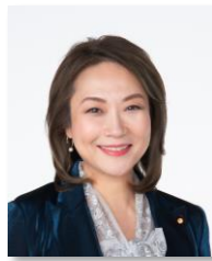
衆議院議員 たかがい 恵美子

初春の穏やかな日和に皆様の健康とご多幸を祈りながら、スタートダッシュで職務に臨んでおります。