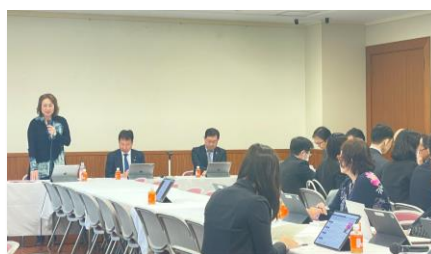
女性の生涯の健康に関するプロジェクトチーム