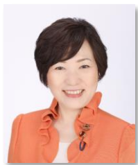
衆議院議員 あべ 俊子

新しい年を迎えた日に発生した能登半島地震で亡くなられた方々のご冥福をお祈りし、被災された皆様方には衷心よりお見舞い申し上げます。