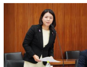
厚生労働委員会質問

看護の現場の声を国政に！初心を忘れず全力で看護政策の推進に向けて取り組みます。本年が皆さまにとってよりよい一年となりますよう祈念致します。