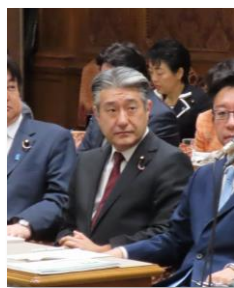
予算委員会理事を務めています