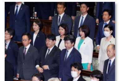
第212回臨時国会開会式