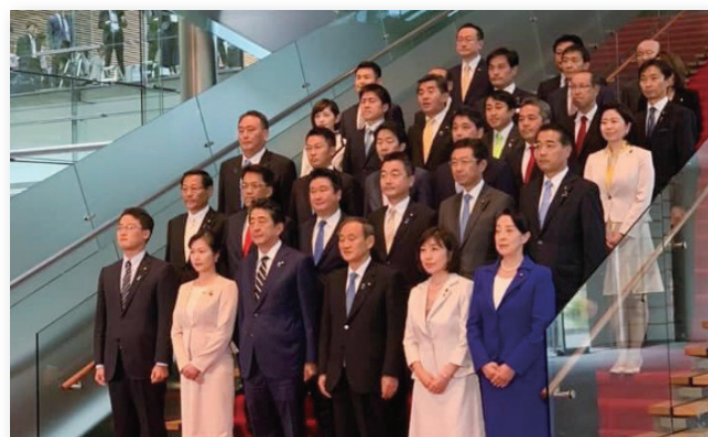
2019年10月 総務大臣政務官就任