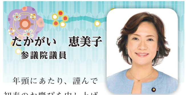
たかがい 恵美子 参議院議員