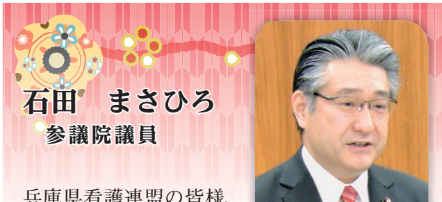
石田 まさひろ 参議院議員

兵庫県看護連盟の皆様、あけましておめでとうございます。今年は夏のオリンピックが56年ぶりに日本にやってくる大きな年。2020年がすばらしき一年となりますよう心からお祈り申し上げます。