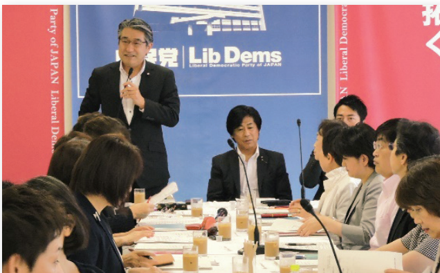
2019年8月 看護問題小委員会にて

看護職の皆様、現場の皆様と共に手を携え活動してまいりますので、今年もどうぞよろしくお祈り申し上げます。