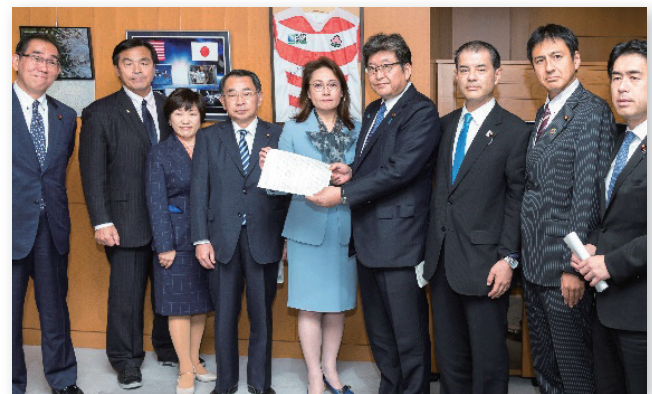
2019年10月 部会長として文科大臣申し入れ