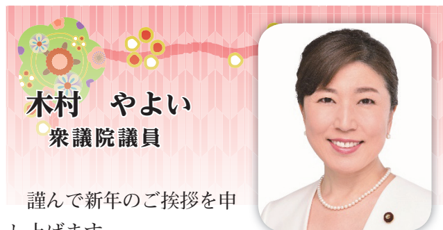
木村 やよい 衆議院議員