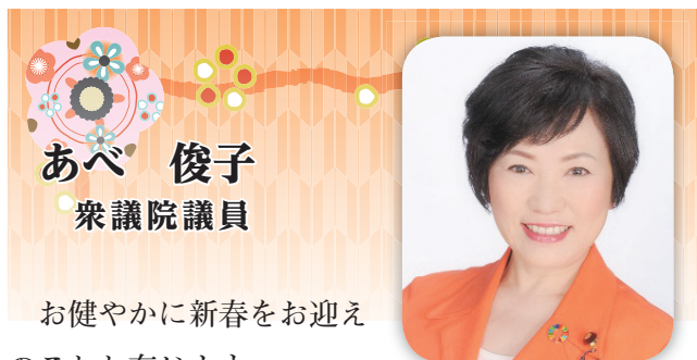
あべ 俊子 衆議院議員